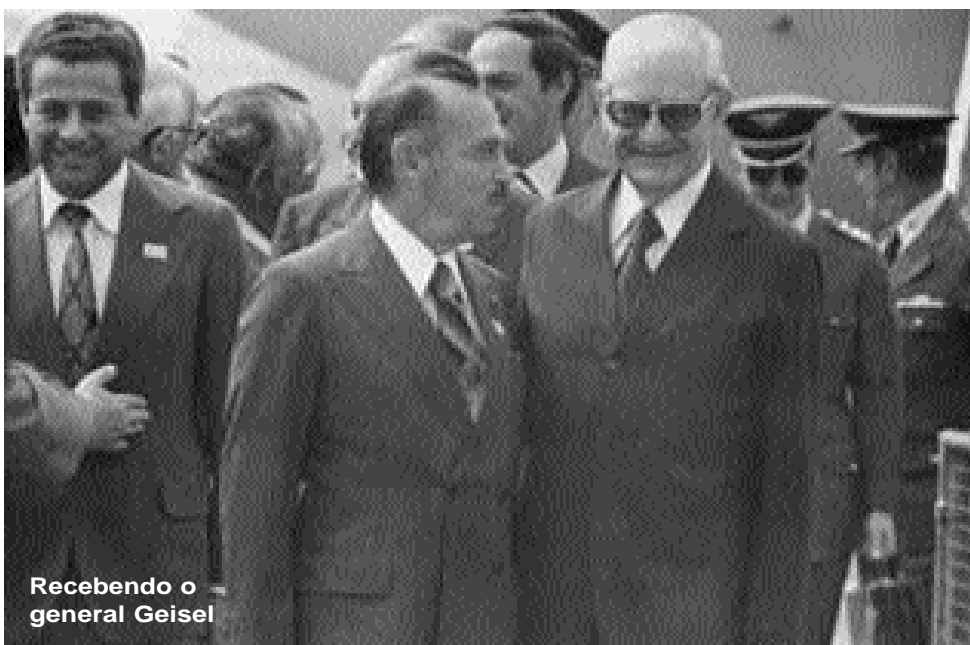
Recebendo o general Geisel

O ingresso do patriarca Levindo Coelho na política ocorreu a pedido do então governador do Estado Raul Soares. Levindo assumiu a chefia da Campanha Civilista de 1910 em Ubá, tornando-se a liderança de expressão. Logo em seguida, elegeu-se vereador e depois senador estadual