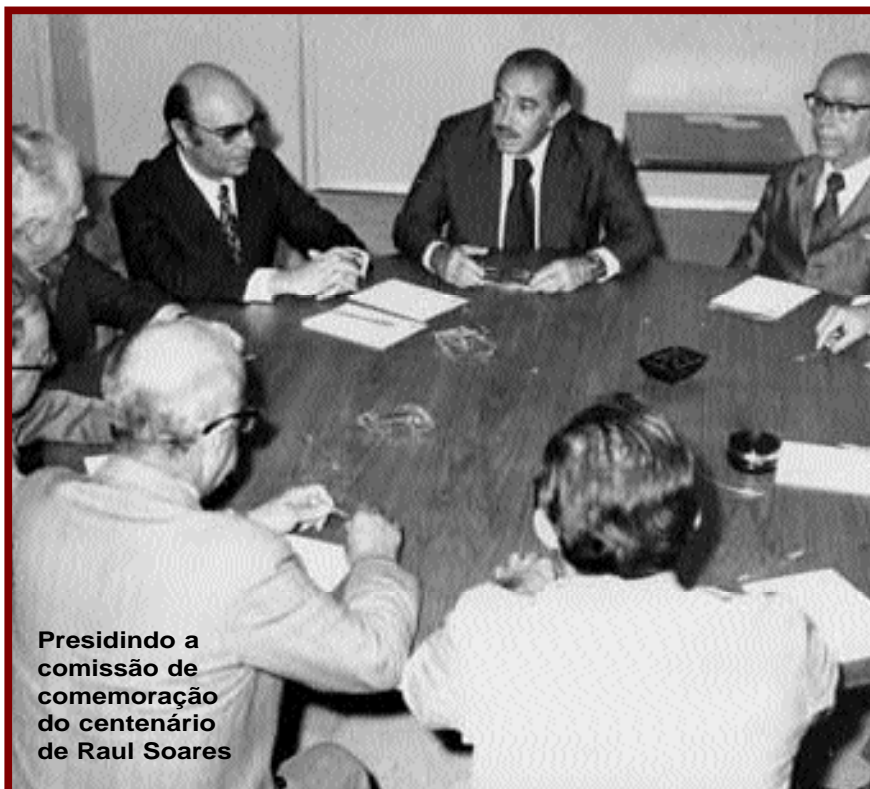
Presidindo a comissão de comemoração do centenário de Raul Soares

O zanam Coelho iniciou sua vida pública em 1947. Nesse ano, redemocratizado o país, foi eleito o mais jovem deputado na Constituinte Estadual, na 1ª Legislatura (47/51). No mesmo ano, seu pai atuou como senador na Constituinte federal.