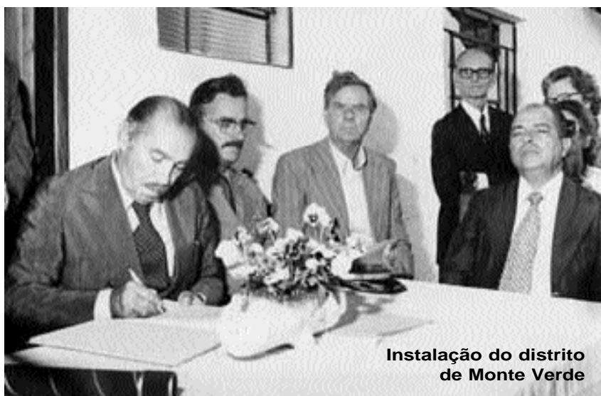
Instalação do distrito de Monte Verde

casas desabam. O serviço de abastecimento de água é interrompido. Cresce a preocupação em relação às doenças epidêmicas. Desabrigados são espalhados por toda parte, inclusive nas dependências do Parque de Exposições da cidade. Em outras cidades, a situação era a mesma.