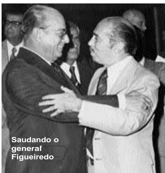
Saudando o general Figueiredo