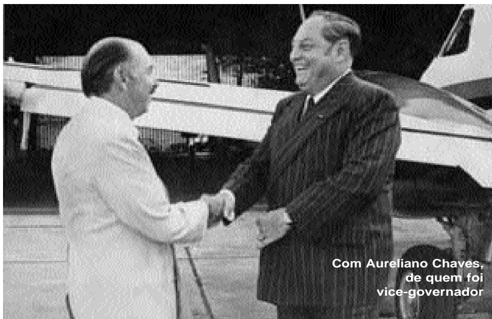
Com Aureliano Chaves, de quem foi vice-governador