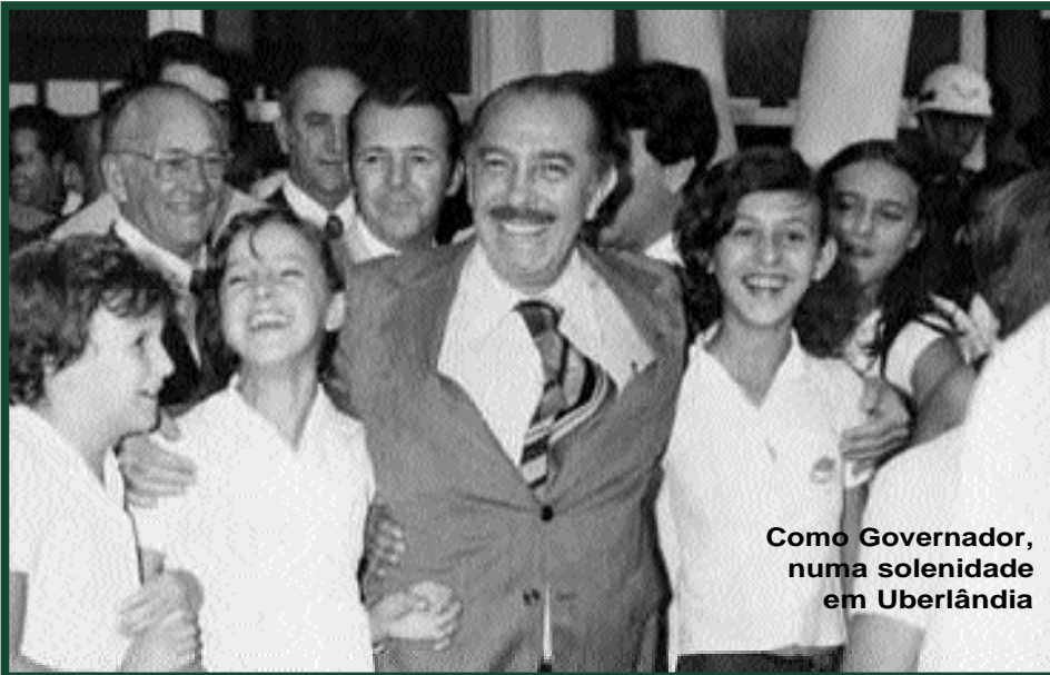
Como Governador, numa solenidade em Uberlândia

* Ex-secretário de Estado da Educação do Governo Ozanam Coelho.